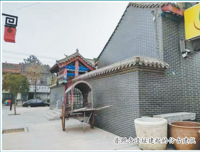
普照寺遗址建起的仿古建筑