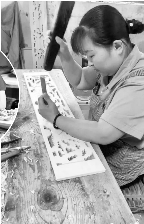
一件木雕作品的制作需要经过前后十几道工序