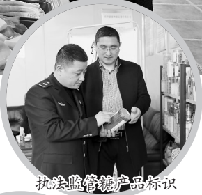
执法监管糖产品标识