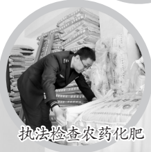
执法检查农药化肥