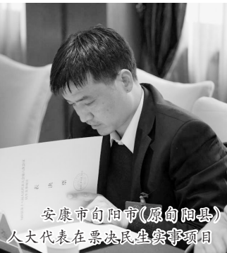
安康市旬阳市(原旬阳县)人大代表在票决民生实事项目