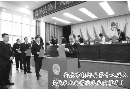
安康市镇坪县第十八届人民代表大会票决民生实事项目

制，是‘发展全过程人民民主’要求的基层实践。为达成这一目标，安康将民生问题的征集、决定、监督、评价等诸多环节，衔接到人民代表大会制度的轨道上，充分发挥人民代表大会的民主渠道作用。”安康市人大常委会主任邹顺生说。