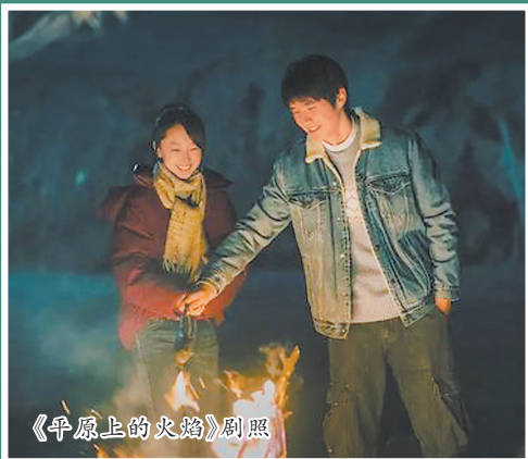
《平原上的火焰》剧照

随着12月3日《古董局中局》的上映,今年贺岁档大幕正式开启。截至目前,共有37部新片定档12月档期。不过,细心的观众发现,温情幽默的喜剧电影在今年的贺岁档可谓“鲜见”,代之以多元化的影片类型。个中原因,与近年来贺岁档悄然发生的改变不无关系。