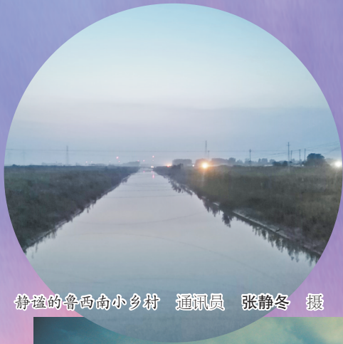
静谧的鲁西南小乡村

冬日夕阳美如画,微微东风醉晚霞。菏泽冬日的夕阳有它独特的美丽,让我们跟着摄影者的镜头去体验它的美——