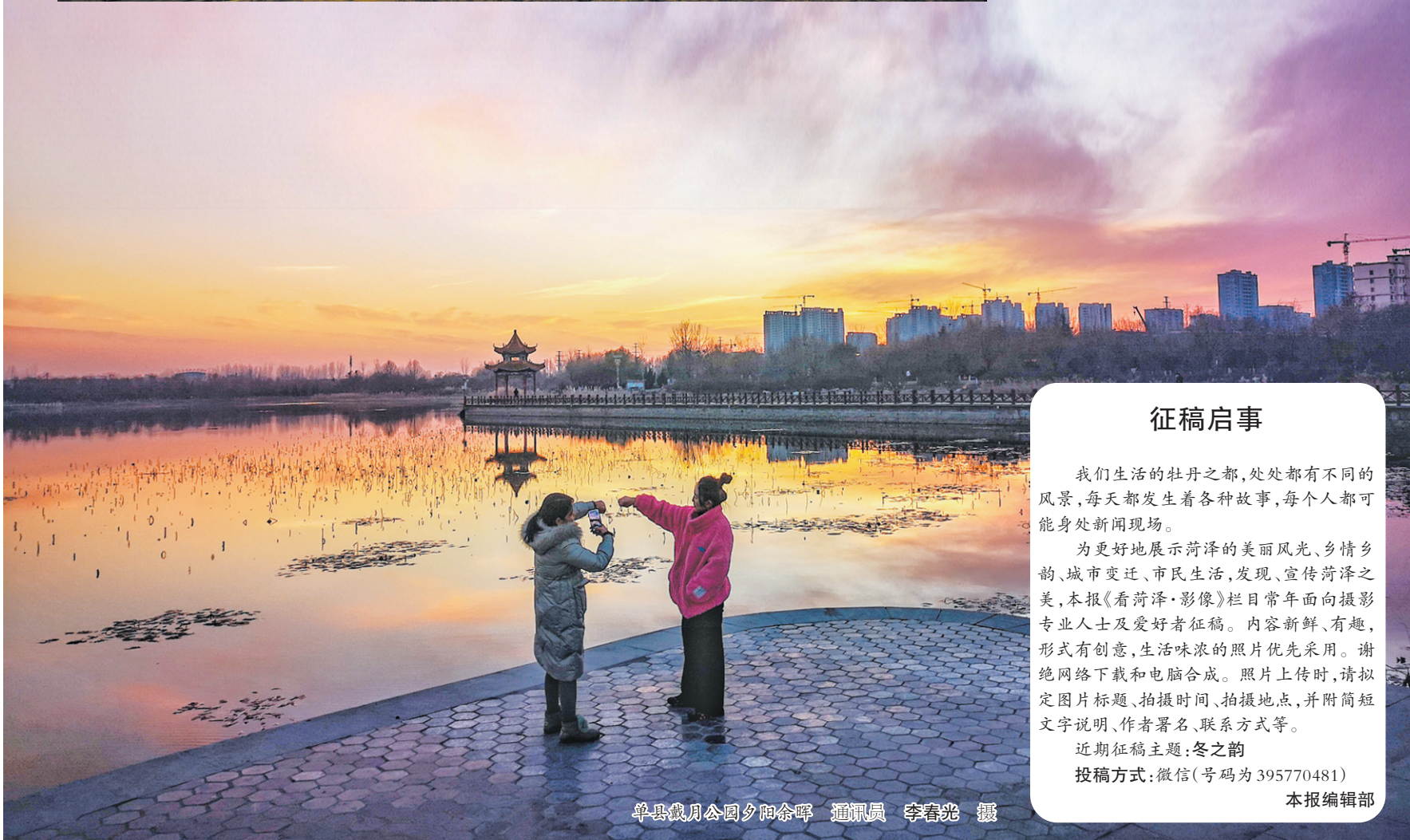
单县戴月公园夕阳余晖