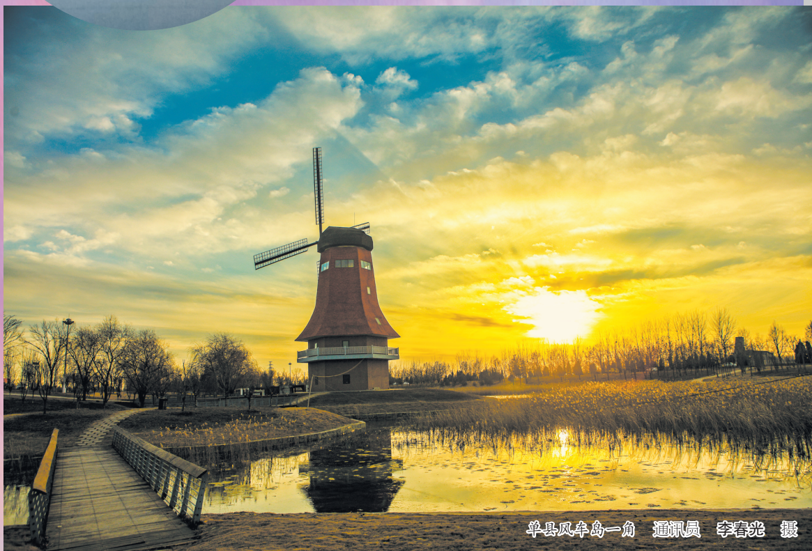
单县风车岛一角