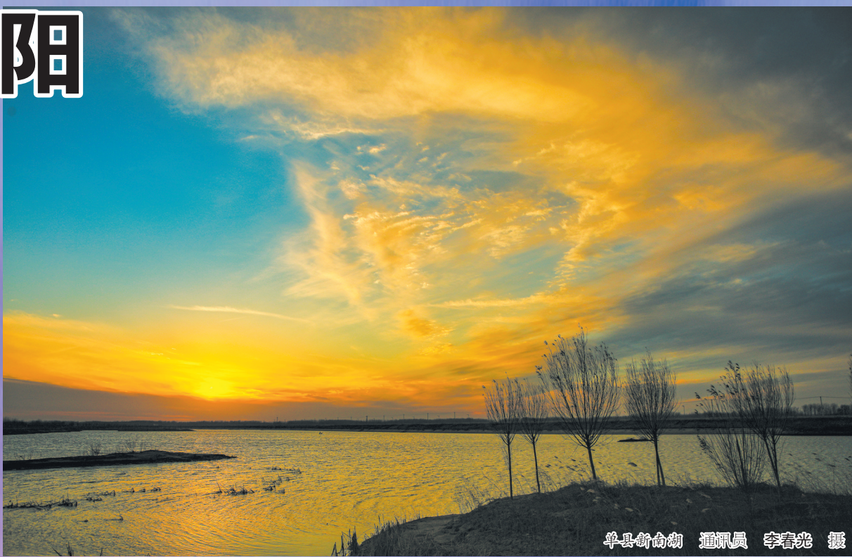
单县新南湖