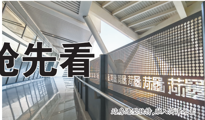
站房造型独特,融入菏泽元素