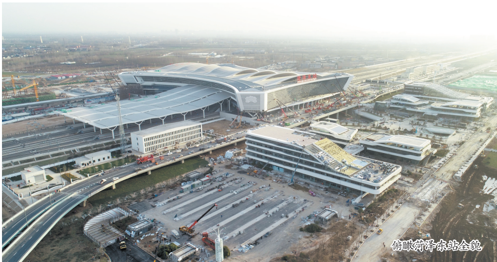
俯瞰菏泽东站全貌