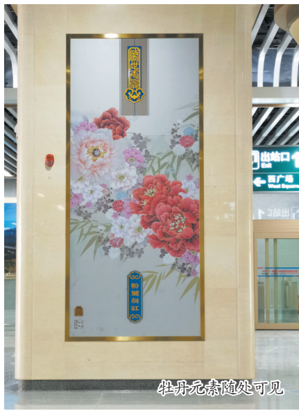
牡丹元素随处可见