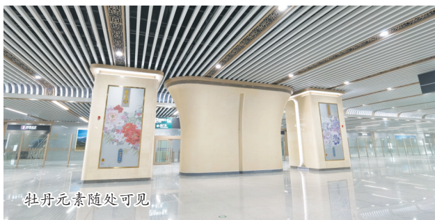
牡丹元素随处可见

菏泽东站距菏泽市区7.6km,距菏泽机场约20km,车站总建筑面积213289平方米,车场规模6台15线,为线上式高架站房。站房结构共分为三层:出站层、站台层、高架层,每层在局部设有夹层。