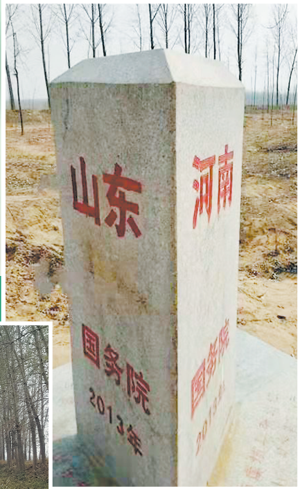
山东、河南、安徽三省界碑

朱高台子是村名,单县人喜欢直呼高台子。 朱高台子与河南、安徽两省接壤,隶属山东省菏泽市单县蔡堂镇,坐落于废黄河滩区,曾面对滔滔东逝黄河,走过数百年岁月沧桑,至今依旧人口兴旺、百业昌盛。 《单县志》记载,清雍正十一年(1733年),朱、杨、吴三姓先后迁居此地,因朱氏族人数众多富足,且村基较高,三姓合议,称朱高台子。 据悉,旧时,为防御匪患,朱高台子民众围村修筑了3米高的寨墙,周长达800米,墙外有3米深的寨海,东、西南、北四面各有大门,并构筑了四角炮楼,形成了一个“边塞城防”。 民间传说,朱高台子附近曾有一个叫朱老家的小村落,朱氏兄弟八个,家大业兴,却无功名俸禄,甚不满足。是时朱家陵墓坐落于村子的西南角,面朝黑水河,背依沙土丘,自以为凤凰栖息宝地,