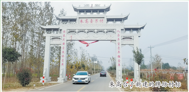
朱高台子新建的牌坊村标