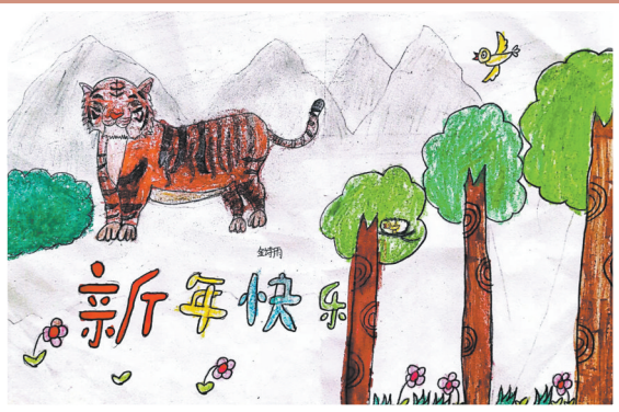
单县南城第二小学三·一班 金诗雨 (小记者编号:sx02106)