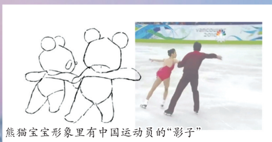
熊猫宝宝形象里有中国运动员的“影子”