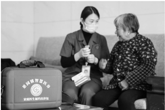
在湖南省长沙市长沙县果园镇杨泗庙社区,医务人员指导居家老人用药