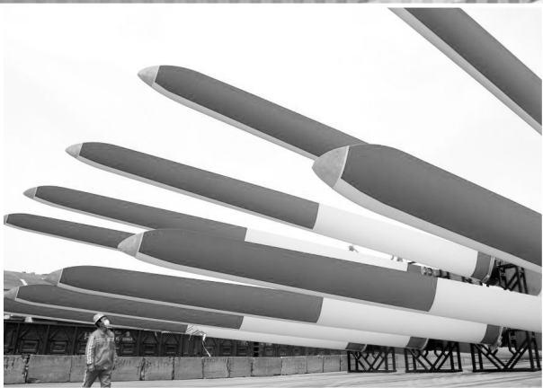
风力发电机叶片在江苏连云港港码头等待装船外运

政府工作报告还部署具体举措加强金融对实体经济的有效支持。“宏观政策一定要协同,才能产生‘1+1>2’的效果。”刘尚希说。