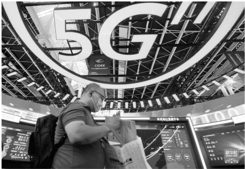
在河北省石家庄市举行的2021中国国际数字经济博览会上,参观者走过5G智慧展区