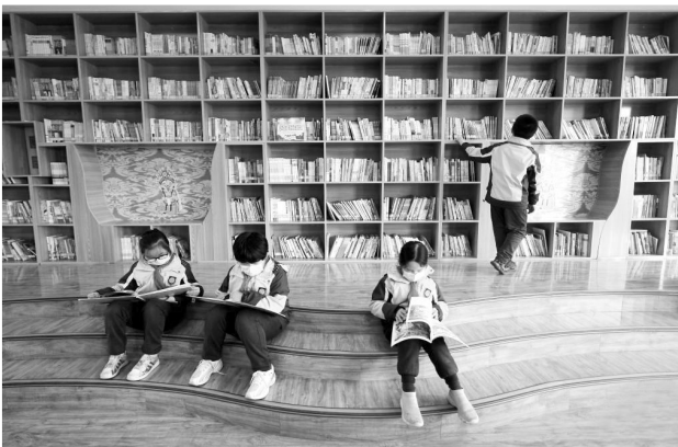
河北省石家庄市桥西区裕华西路小学参加课后托管的学生在图书馆阅读