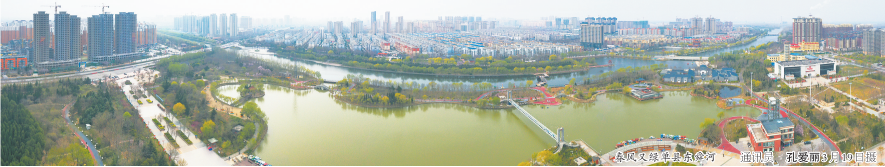
春风又绿单县东舜河 通讯员 孔爱丽3月19日摄

2、投稿邮箱: zqs5882200@163.com, 邮件标题注明“春到菏泽”征稿图片,提交图片请按照“标题、摄影人、联系电话、拍摄时间及地点、简单图片说明”标注。 本报编辑部