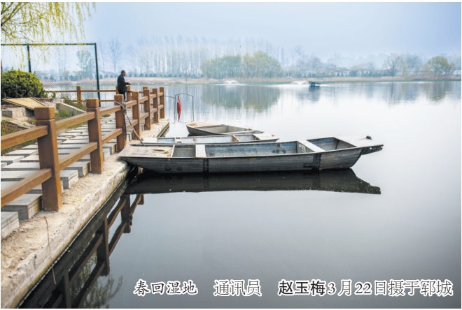
春回湿地 通讯员 赵玉梅3月22日摄于郓城