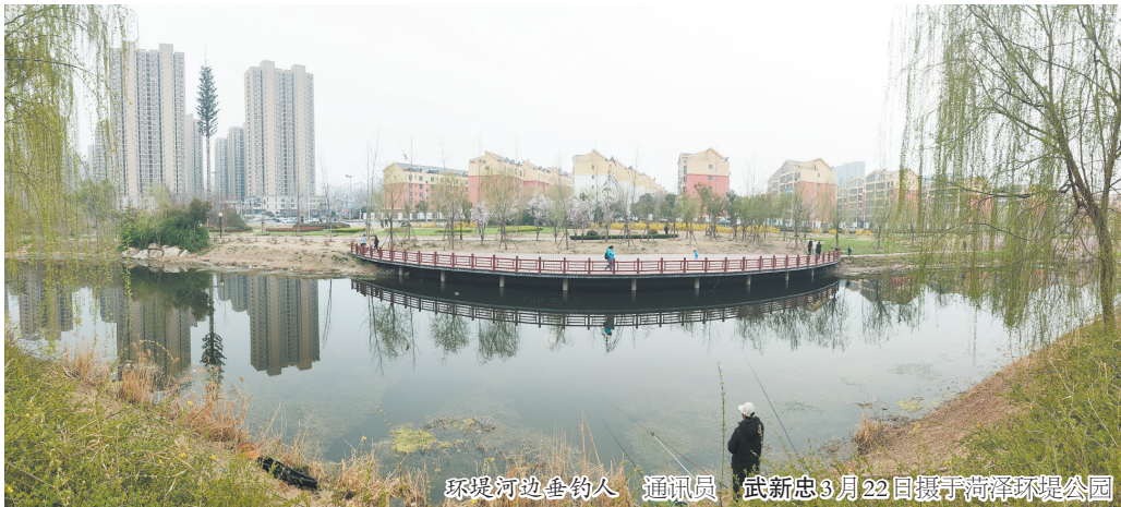
环堤河边垂钓人 通讯员 武新忠3月22日摄于菏泽环堤公园