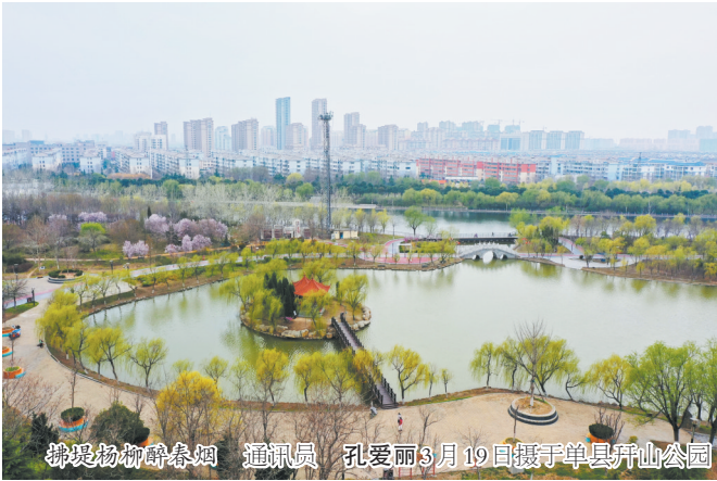
拂堤杨柳醉春烟 通讯员 孔爱丽3月19日摄于单县开山公园