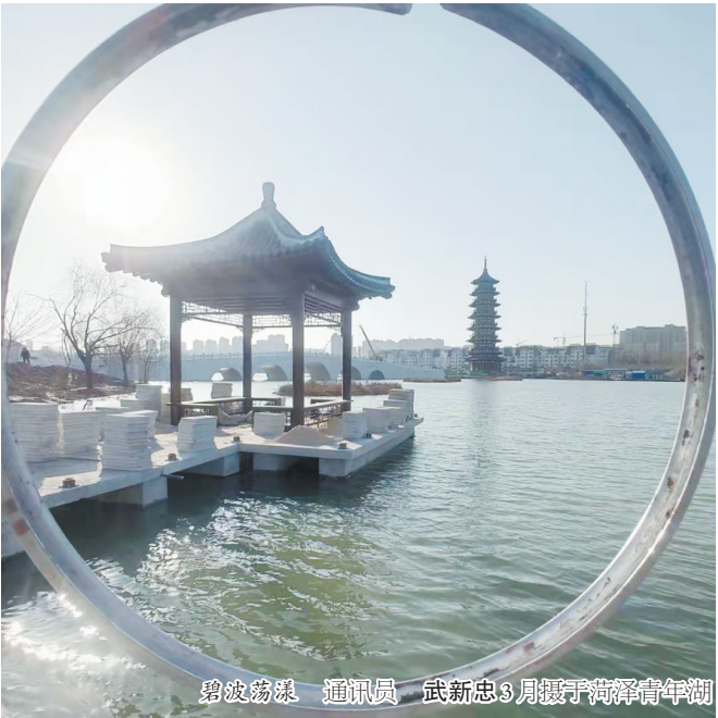
碧波荡漾 通讯员 武新忠3月摄于菏泽青年湖