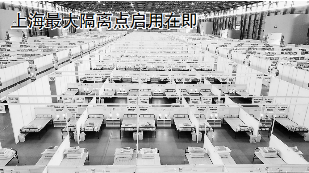
上海最大隔离点启用在即

5656例;吉林1032例;福建85例;河北75例;辽宁52例;江苏32例;安徽31例;黑龙江24例;山东23例;广东14例;广西13例;河南10例;甘肃10例;江西9例;浙江7例;天津6例;云南3例;新疆2例;山西1例;内蒙古1例;湖北1例;湖南1例;海南1例;重庆1例)。 据新华社