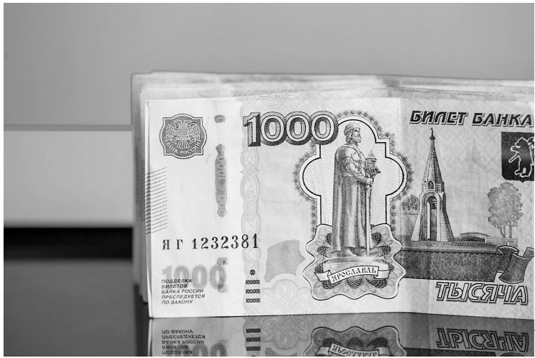
这是3月24日在俄罗斯首都莫斯科拍摄的卢布钞票

继天然气后,俄罗斯方面3月30日表示,可能要求更多俄罗斯商品以卢布结算,包括能源和农产品。 面对西方对俄方空前制裁,俄总统弗拉基米尔·普京23日宣布,俄方向欧洲联盟成员国等“不友好”国家和地区供应天然气时将改用卢布结算。普京已责成政府、中央银行和俄罗斯天然气工业股份公司在本月31日前采取相应措施。 俄罗斯国家杜马主席维亚切斯拉夫·沃洛金30日表示,以卢布结算商品应该扩大至原油、谷物、金属、化肥、煤炭和木材。 俄总统新闻秘书德米特里·