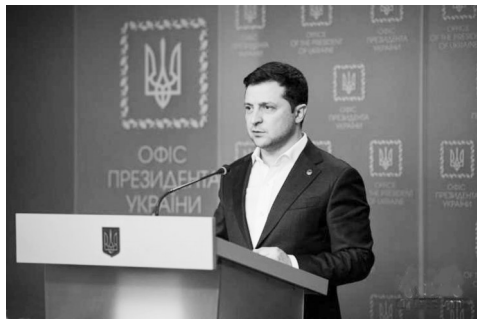
乌克兰总统泽连斯基