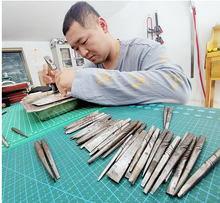
通过合理使用不同的篆刻才能呈现出千变万化的效果