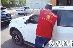
交通疏导和秩序维护