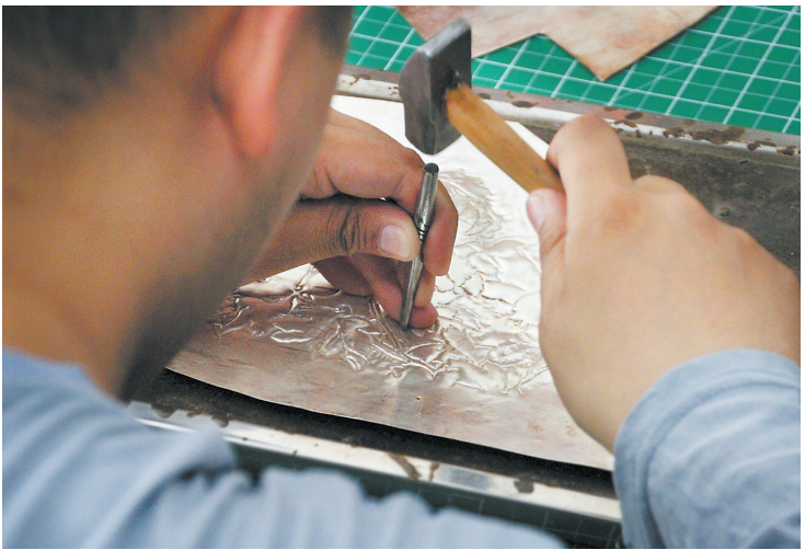
一篆刻一刻间，冷硬金属变成艺术品