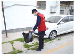
积极宣传“创城”知识

到西门进行交通疏导和秩序维护,早高峰时期疏导进院车辆近千辆。 同时结合党员“双报到”工