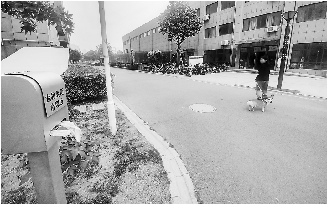
市区部分小区在公共场所投放宠物粪便清理袋

根据《菏泽养犬管理条例》规定,盲人饲养导盲犬、肢体重度残疾人饲养扶助犬,免交养犬管理