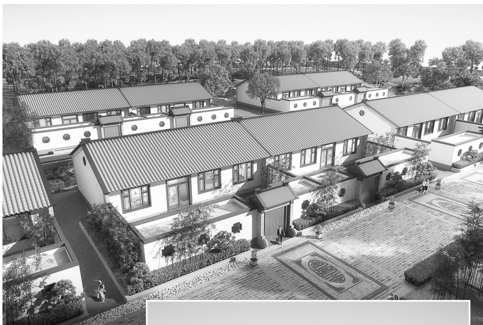
上图:一层农居设计图之一。

这套设计图集发布后引发各界热议。有网友表示,这个做法好,既起到了有序规范的作用,又让农户可以结合实际有所选择。这些设计高端大气、富有特色,可为发展乡村旅游、建设美丽乡村打下好的基础。