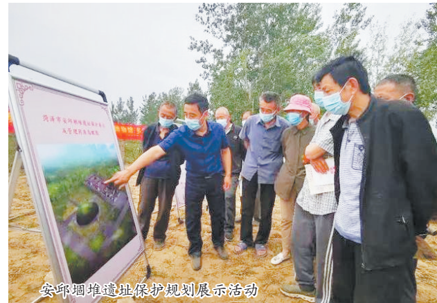
安邱堽堆遗址保护规划展示活动

同时,安邱堽堆遗址发现的较为密集的房子遗迹是非常可贵的,它是研究龙山文化聚落构成比较典型的材料,尤其是门道下类似后世的人祭现象,对进一步了解当时的社会面貌提供了极其重要的线索。商代文化面貌同中原地区基本一致,但又具有东夷文化的因素。尤其重要的是安邱堽堆岳石文化层的发现,在横向方面填补了岳石文化在鲁西南地区的空白,在纵向方面也基本填补了鲁西南地区龙山文化与商文化之间的空白。这无论对考古学,还是对历史学都有重要的意义。