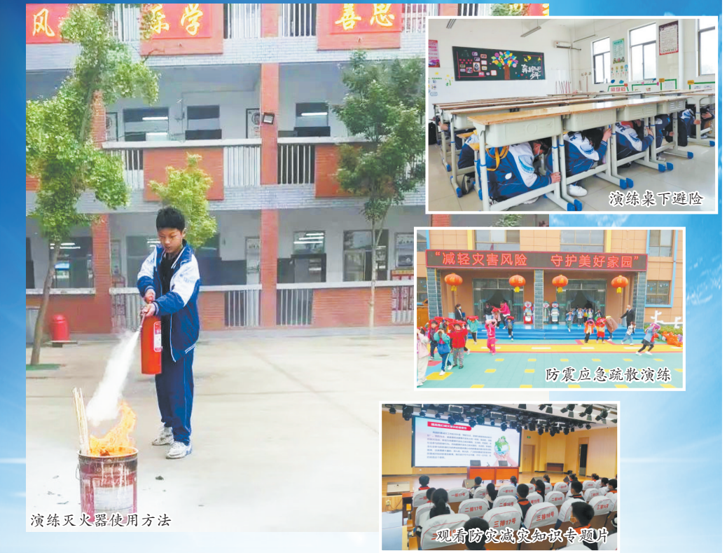
演练灭火器使用方法