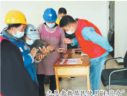
志愿者教居民使用“E应办”

在今年三月份,正值我市春耕浇灌的时节,但由于机井数量有限,菏泽开发区岳程街道大高庄社区的居民却犯了难。3月29日,社区居民将相关问题上传至