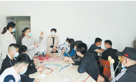
残疾人技能培训现场