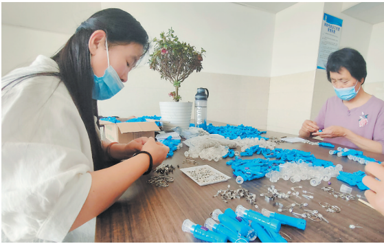
“如康家园”为残疾人提供就业平台

“建设50个“如康家园”残疾人之家作为民生实事之一,被列入了2022年菏泽市政府工作报告。菏泽市有各类残疾人60多万,“如康家园”为他们打造了一个融入社会、共享经济社会发展成果的家。此外,我市还采取多种措施助推残疾人就业,让他们通过自己的努力赢得尊重、活出精彩。