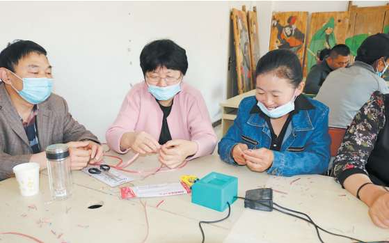
残疾人学习手工制作