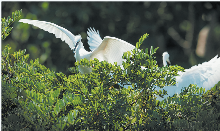
《美丽张康鸟儿来》摄影作品展