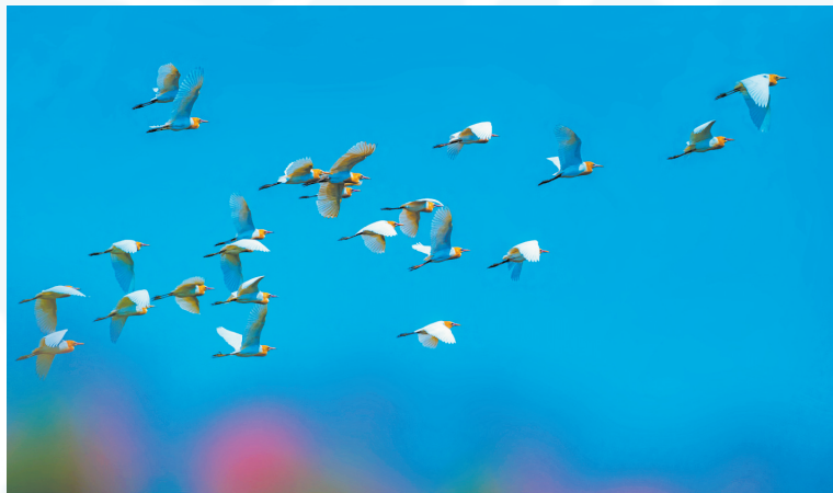
《美丽张康鸟儿来》摄影作品展