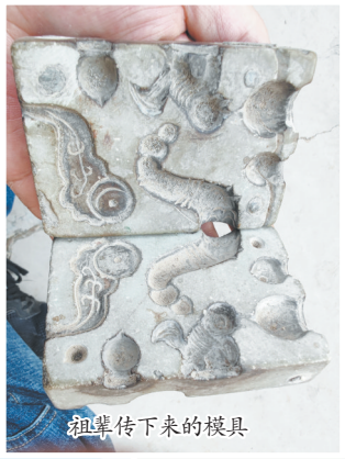
祖辈传下来的模具