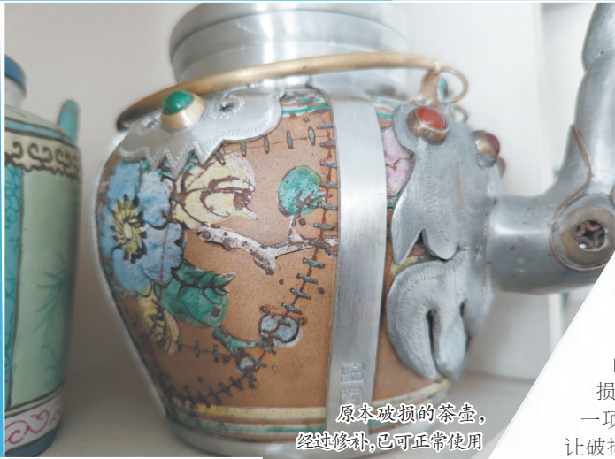
原本破损的茶壶， 经过修补，已可正常使用