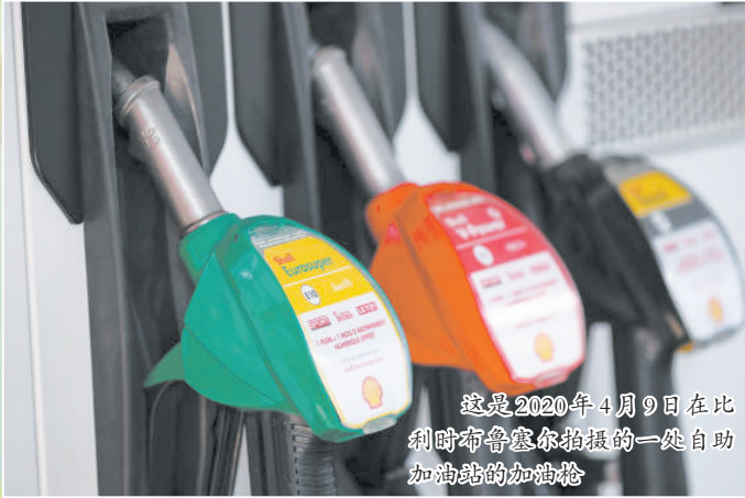
这是2020年4月9日在比利时布鲁塞尔拍摄的一处自助加油站的加油枪

据介绍,欧盟新一轮制裁方案还包括将俄最大银行俄罗斯储蓄银行排除在环球银行间金融通信协会系统之外、禁止3家俄国家媒体的新闻信息产品以任何形式在欧盟落地和传播等。