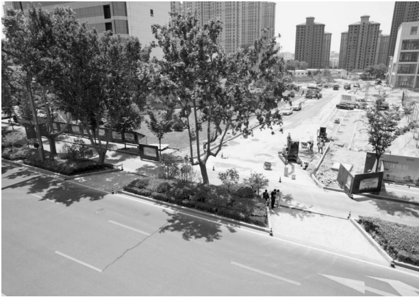
上图:即将通车的规划支路与中华路连接处进出口分离。 右图:俯瞰连接中山路与中华路的规划支路。