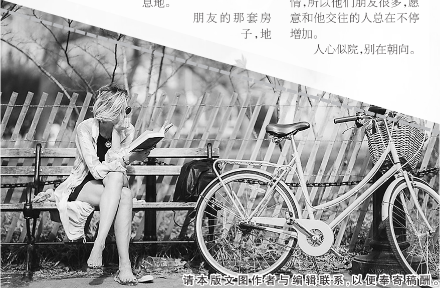
请本版文图作者与编辑联系,以便奉寄稿酬。

处城市的黄金地带,其价值,是我堂哥那套小县城房子没法比的。同理,两个院子,也该是如此。然而,一个成了杂物的存放地,一个成了心灵憩息的好去处;一个备受冷落,一个广受欢迎。两者之所以有这么大的区别,是在于朝向的不同:一个朝北,阴冷沉郁,一个朝南,温暖阳光。 由院子的朝向我想到了人:有些人,就像朋友家朝北的院子,阴冷沉郁,让人不敢、不想去接近;而有些人,则像堂哥家朝南的院子,待人温暖、阳光、热情,所以他们朋友很多,愿意和他交往的人总在不断增加。 人心似院,别在朝向。