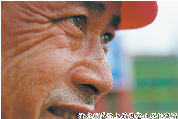
汗水顺着脸上的沟壑止不住流淌