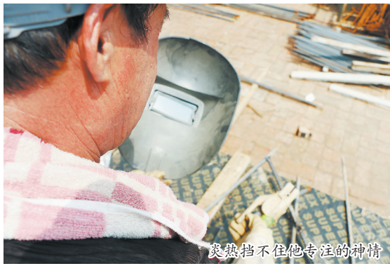
炎热挡不住他专注的神情