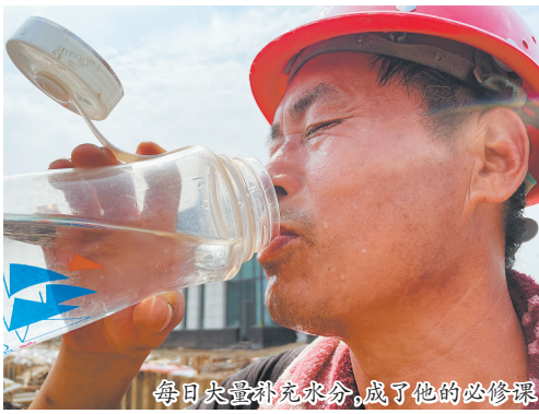
每日大量补充水分,成了他的必修课