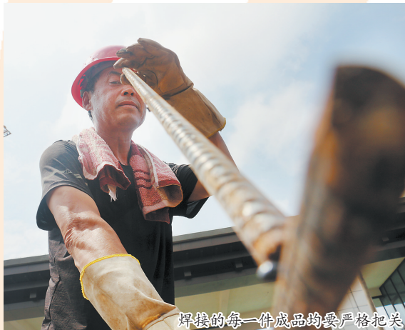
焊接的每一件成品均要严格把关