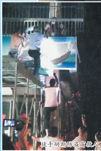
徒手掰断防盗窗救人