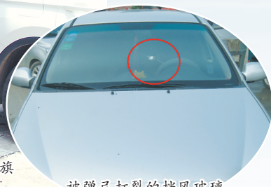
被弹弓打裂的挡风玻璃