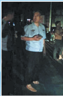
救助被火围困群众跑丢了鞋子