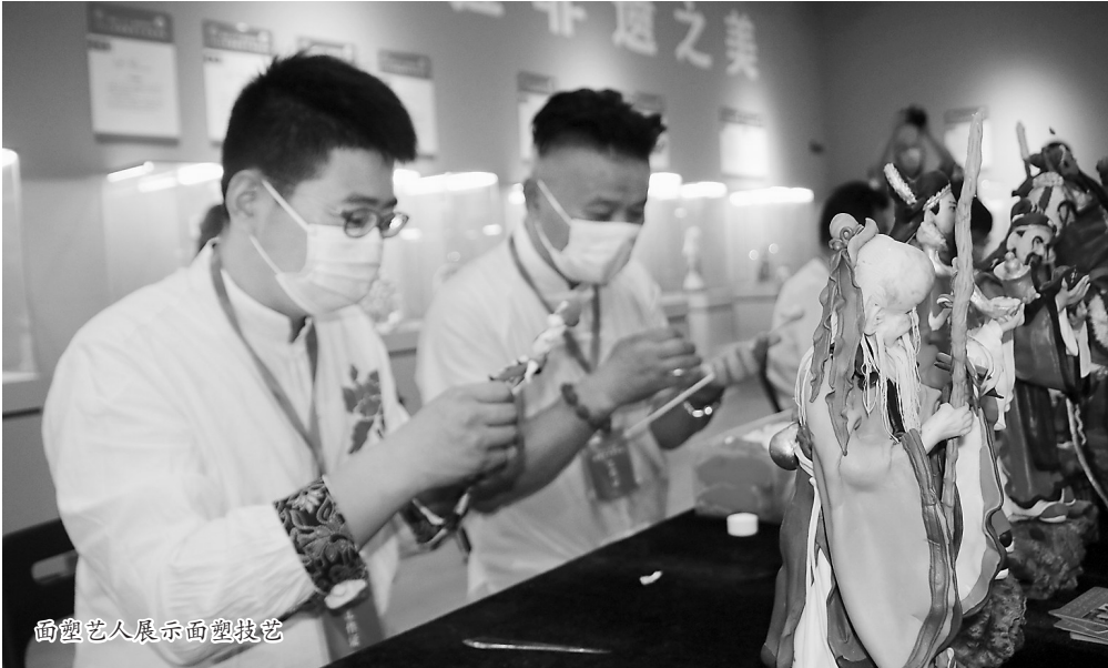
面塑艺人展示面塑技艺

文化的当代应用”讲座。与会嘉宾还参观了菏泽市张得蒂雕塑馆、菏泽市地方戏曲传承展示中心、菏泽民俗馆暨面塑展厅、菏泽高新区马岭岗镇穆李村曹州面塑艺术馆、面塑艺人工作室,并到穆李小学调研面塑艺术进校园情况。 菏泽面塑发展已有180余年历史,早在2008年就被国务院列为国家级非物质文化遗产项目。 市委、市政府对民间艺术高度重视,提出了面塑艺术发展规划,打造区域性面塑品牌,推动乡村文化振兴,有效实现优秀传统文化创造性转化和创新性发展,用艺术更好赋彩人民美好生活,更好赋能城市文化发展。