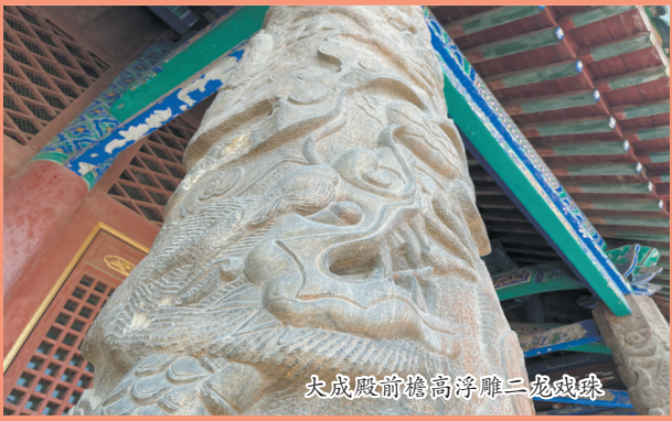
大成殿前檐高浮雕二龙戏珠