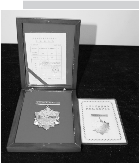
中国人民抗日战争胜利60周年纪念章

历史因铭记而永恒。今天,我们一起纪念“七七事变”爆发85周年,纪念赵登禹等革命先烈,勿忘国之殇,吾辈当自强。