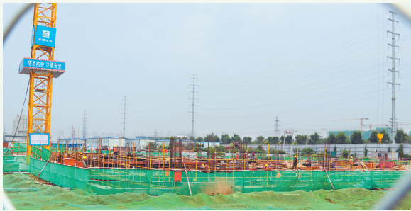
菏泽医专新校区建设现场