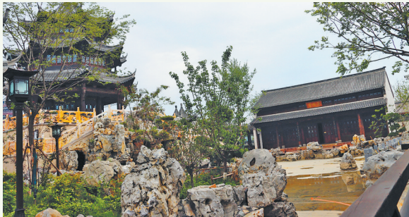
曹州老城保护性开发项目一期首开区一景