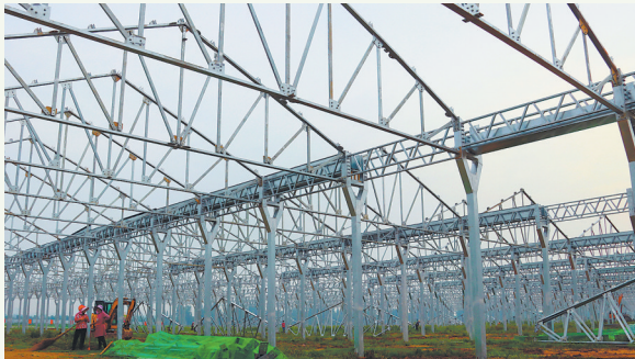
牡丹区农高区花卉交易物流中心项目建设现场