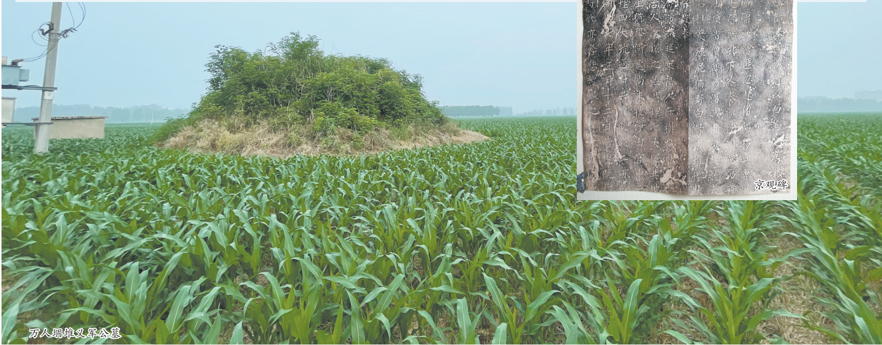
万人堙堆义军公墓