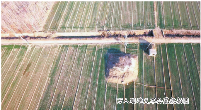
万人堙堆义军公墓航拍图

位于郓城县城西南15公里处的武安镇飞集村西南60米处,在平坦的农田里一座土堆显得格外引人注目,这个土堆当地人称为万人堙堆,也叫万人堙堆义军公墓,系明天启二年徐鸿儒起义军部分将士聚葬处,义军约七千人,聚尸一处。万人堙堆义军公墓对于研究我国古代农民运动具有重大价值,于2022年入选第六批省级文物保护单位。