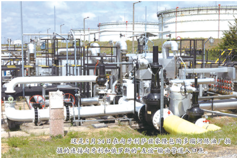
这是5月24日在匈牙利萨兹豪隆包陶多瑙河炼油厂拍摄的连接匈牙利和俄罗斯的“友谊”输油管道入口点。

俄罗斯石油管道运输公司当地时间10日说,已经恢复从过境乌克兰的“友谊”输油管道南线向匈牙利、斯洛伐克输油。乌克兰外交机构9日晚说,由于黎巴嫩方面取消订单,代理商正在为首艘驶离乌克兰的运粮船“拉佐尼”号所载粮食寻找新买家。