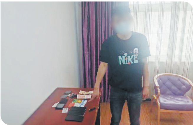
犯罪嫌疑人展示手机等作案工具。