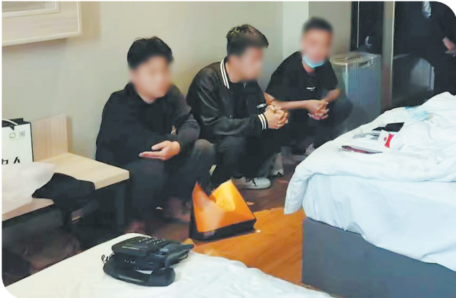
部分犯罪嫌疑人在宾馆内被抓获。