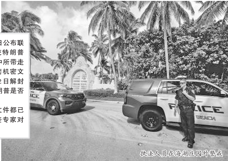
执法人员在海湖庄园外警戒

《华尔街日报》12日报道,FBI文件显示特工8日从海湖庄园搜走约20箱物品,包括照片、手写纸条、对特朗普盟友斯通的行政命令、有关法国总统马克龙的信息,以及佛州一名联邦法官批准的搜查令。