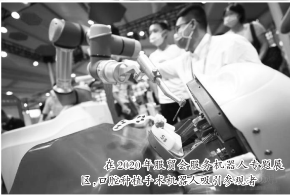
在2020年服贸会服务机器人专题展区,口腔种植手术机器人吸引参观者