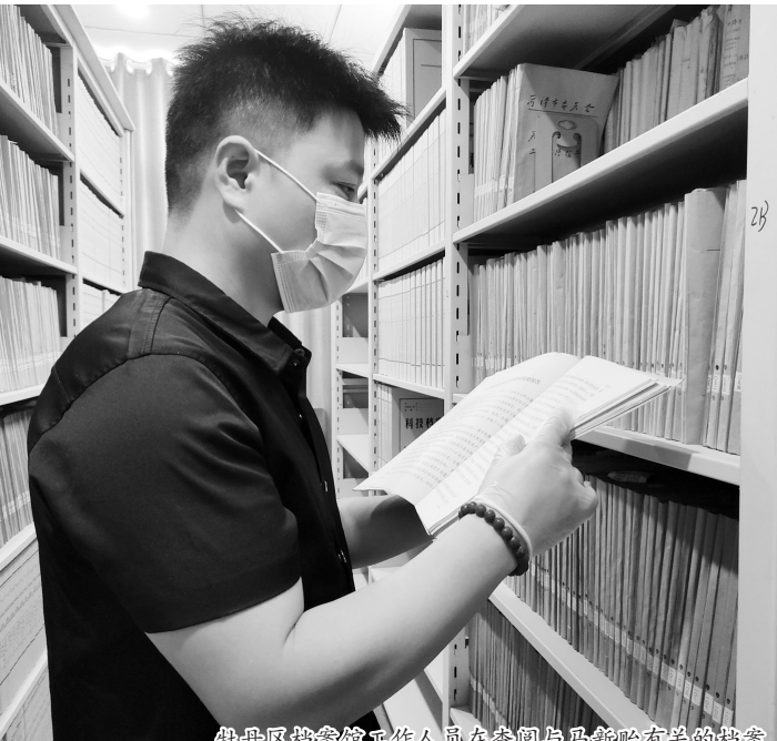
牡丹区档案馆工作人员在查阅与马新貽有关的档案