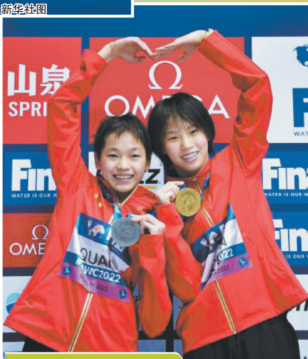
冠军陈芋汐(右)和亚军全红婵在颁奖仪式上合影