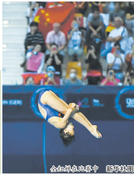
全红婵在比赛中