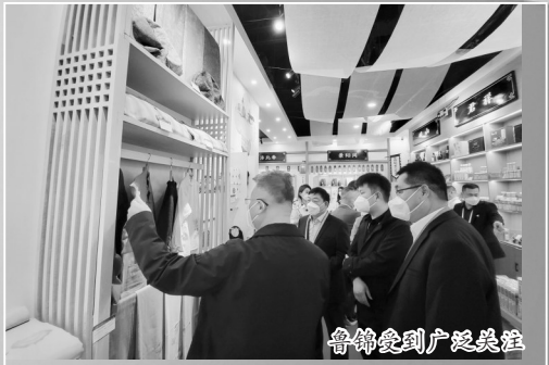
鲁锦受到广泛关注

“通过进博会搭建的舞台,我们开阔了眼界,增长了见识。”鲁锦历史悠久,鲁锦的制作要经过72道工序,属国家级“非遗”。乡韵鲁锦是“山东省老字号”,其秉承“讲中华故事,做传承手艺”的理念,在保留传统工艺的同时,创新产品品种,让绿色、健康、环保、纯棉服装、床品进入千家万户。