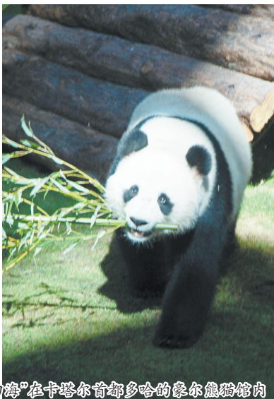
大熊猫“京京”(左)、“四海”在卡塔尔首都多哈的豪尔熊猫馆内

新华社多哈11月17日电 在2022卡塔尔世界杯即将开幕之际,来自中国的大熊猫“京京”和“四海”17日在多哈正式与公众见面,它们居住的多哈豪尔熊猫馆也于当日开馆。