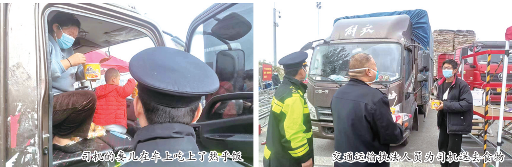
司机的妻儿在车上吃上了热乎饭