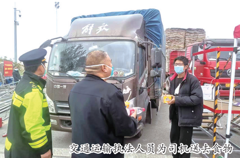
交通运输执法人员为司机送去食物