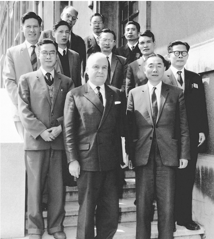
1964年6月,江泽民同志(二排右一)在法国艾克斯莱班出席国际电工委员会会议期间同与会代表合影。