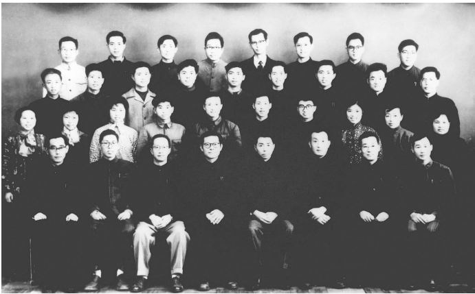
1963年3月,江泽民同志(前排右五)在上海同小型三相异步电机全国统一定额设计领导小组成员合影。

进入20世纪90年代,江泽民紧紧把握经济全球化不断加快的趋势,强调中国要发展、要进步、要富强,就必须对外开放,加强同世界各国的经济、科技、文化的交流合作,吸收和借鉴一切先进的东西。他提出,我们要进一步完善有关政策,继续坚定不移扩大对外开放,不断丰富对外开放的形式和内容,不断提高对外开放的质量和水平,完善全方位、多层次、宽领域的对外开放格局。加入世界贸易组织是党从我国经济发展和改革开放的需要出发作出的重大战略决策,标志着我国对外开放进入了一个新的阶段。江泽民阐明了中国加入世界贸易组织的原则:第一,中国加入世界贸易组织是中国经济发展和改革开放的需要,同样世界贸易组织也