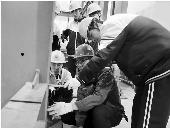
市城建技工学校钢结构工程实操课现场。

本报讯(牡丹晚报全媒体记者 武霏) 产业人才是经济高质量发展的重要支柱,为厚植人才发展沃土,菏泽鲁西新区坚持把人才发展作为经济发展的内在动力,聚焦主导产业,全力搭建人才培育基地。