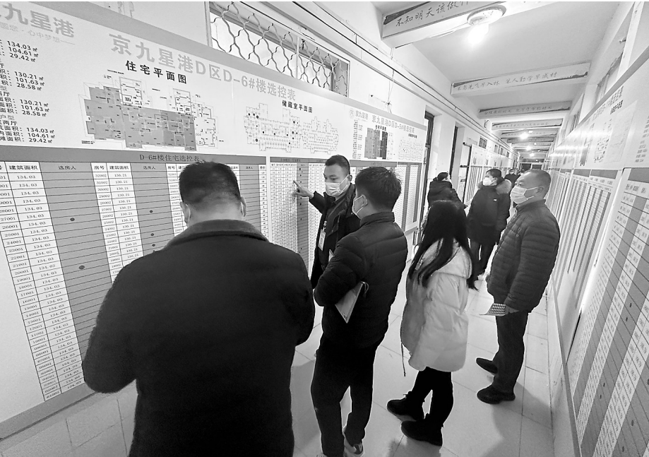
预选房现场,回迁户代表认真查看房源。

本报讯(牡丹晚报全媒体记者 姜璐璐) “这么快就选好了!而且选到了我想要的户型和储藏室!”12月10日一早,菏泽市2017-3(肖楼)旧城区改建项目安置区回迁房公开选房现场,最先选房的刘女士激动地说。