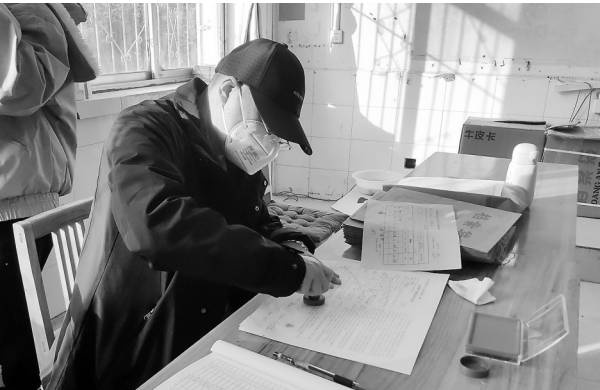
选房结束签订协议。