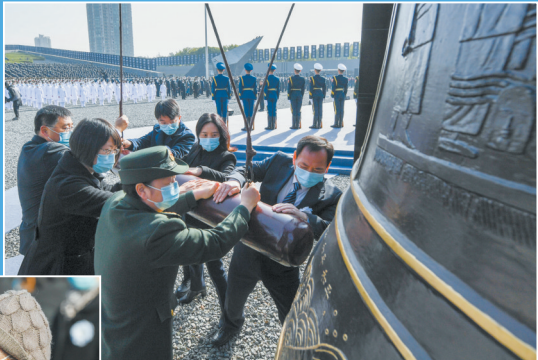
▲12月13日,在南京大屠杀死难者国家公祭仪式现场,社会各界代表撞响和平大钟。