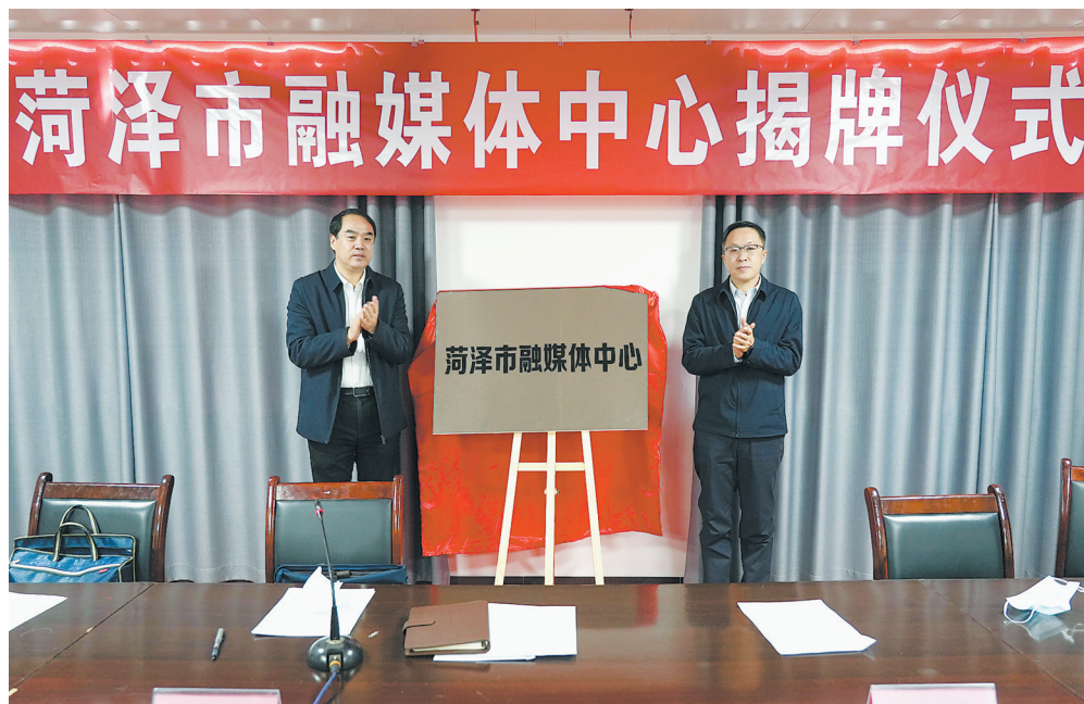
市委常委、宣传部部长周生宏,副市长张鹏出席仪式并为菏泽市融媒体中心揭牌。

仪式上,市委宣传部有关负责人介绍了菏泽市融媒体中心相关情况,菏泽日报社、市广播电视台主要负责人作表态发言。