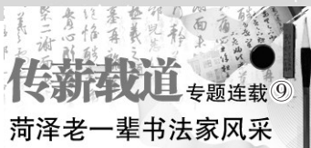
菏泽老一辈书法家风采

在书法创作上,他博采众长、融会贯通,将颜体的体貌特征、结构规律、书写形态进行气质性消化,约取魏碑的拙朴沉雄、气象开阔之态,偶参近代诸家笔意,进行提炼升华,最终形成具有唐之韵、碑之貌的鲜明艺术风格。他所书的无论行草、正楷,尽得颜