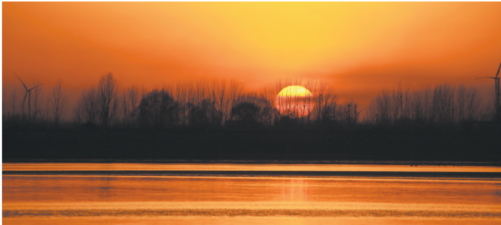
缓缓隐匿 通讯员王继根 2022年12月11日摄于东明县长兴集乡附近黄河滩