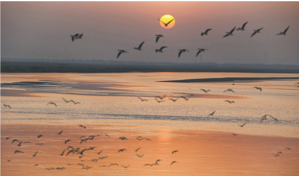
大雁凌空舞 通讯员樊祥金 2022年12月14日摄于东明黄河滩