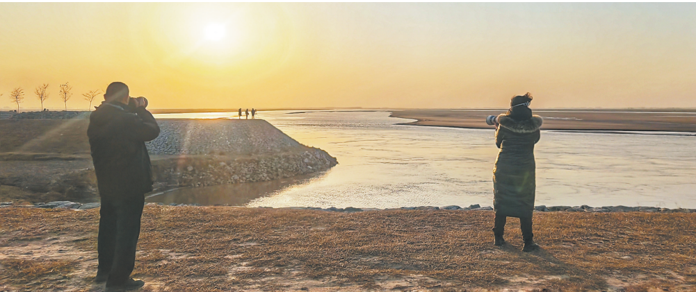
余辉烁烁 通讯员樊祥金 2022年12月14日摄于东明黄河滩