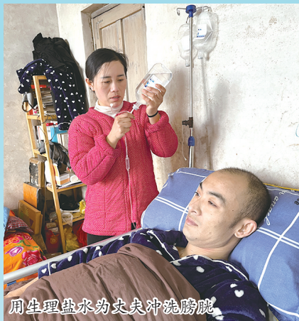
用生理盐水为丈夫冲洗膀胱