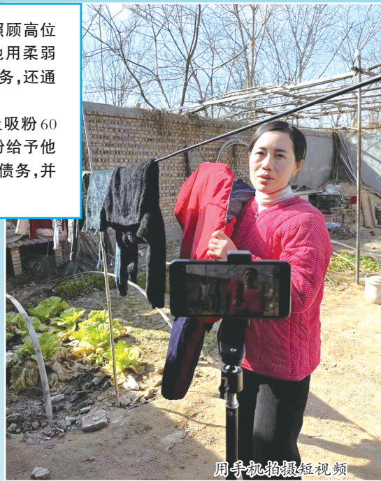
用手机拍摄短视频