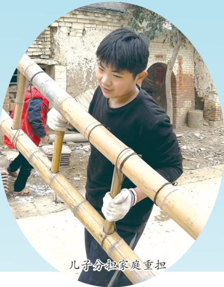
儿子分担家庭重担