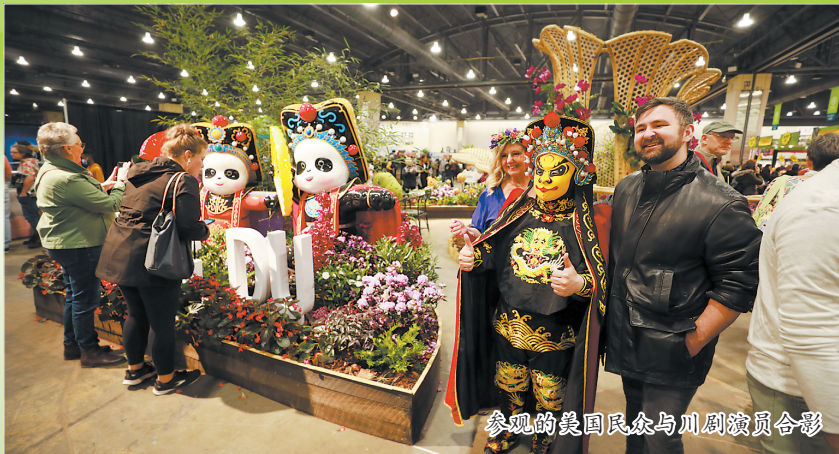
参观的美国民众与川剧演员合影

新华社美国费城3月4日电 一年一度的费城花展4日在美国宾夕法尼亚州费城市开幕,以竹子和大熊猫元素为特色的成都展园当天在花展上亮相,成都也成为费城花展194年历史上首个参展的中国城市。